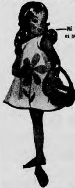
—Mi pelo es negro

TRES ADORABLES MUÑECAS PARA ALEGRAR EL MUNDO DE LAS NIÑAS!