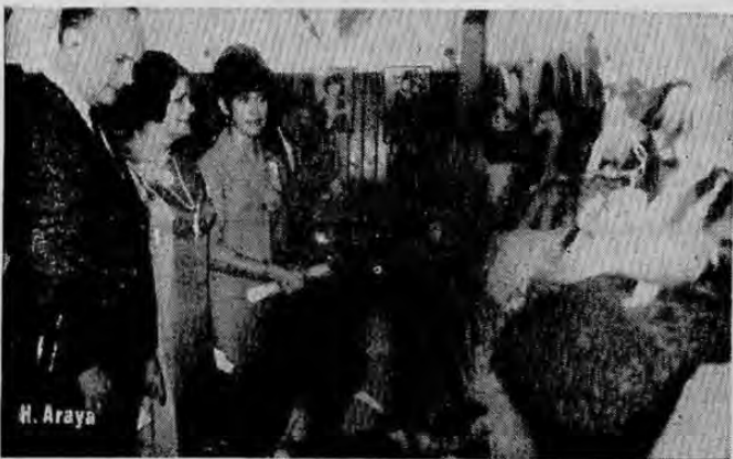
VISITA A LOS STANDS DE LA EXPOSICION. En la Escuela Perú donde se está celebrando la exposición de trabajos realizados, por alumnos del INA, en curso de esta y cuatro meses, el presiden-