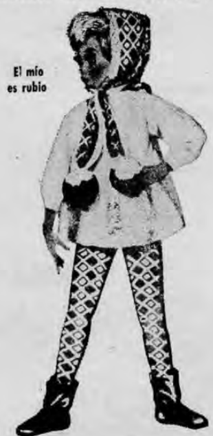
El mío es rubio