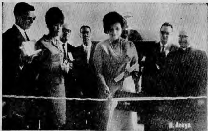
PRIMERA DAMA CORTO LA CINTA — La Sra. de Trejos, Fernández declaró inaugurada la 1ª Exposición anual del Instituto de Aprendizaje. Doña

puesta según la cual se pediría a Gran Bretaña que usase todos los medios para imponer el embargo.