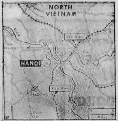
Diciembre 16 — AP— Este mapa muestra el path ferroviario de Yen Vien al norte de Hanoi y el parque de camiones de Van Dien, al sur de la ciudad, que fueron blancos del ataque aéreo de Estados Unidos el martes y miércoles. EE. UU., dijo que las fotos de reconocimiento indican que las bombas, cayeron en los blancos y no en Hanoi mismo como dice los norvietnamitas. 1968.

Señaló que una extensa zona asiática, que incluye a Corea, Japón, Tailandia, Hong Kong, Birmania, India, Australia y Nueva Zelanda "ha sido negado a la expansión de Pekín. "Y seguramente esto no hubiera sido si hubiéramos sido derrotados por Vietnam el Sur o si hubiéramos abandonado" señaló.