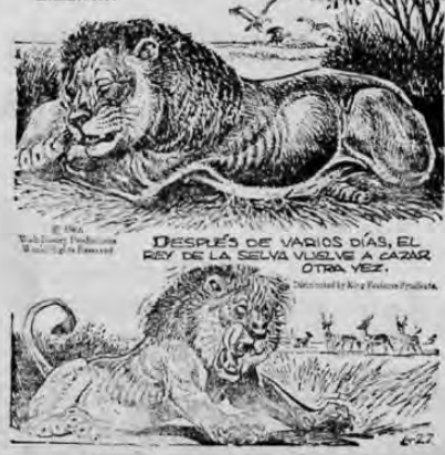
DESPUES DE VARIOS DIAS, EL REY DE LA SELVA VUELVE A CAZAR OTRA VEZ.