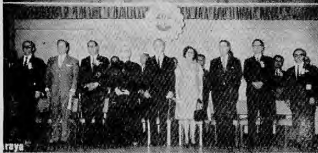
INAUGURADA EXPOSICION DEL INSTITUTO NACIONAL DE APRENDIZAJE — En la Escuela Perú se realizó la solemne ceremonia a la que asistieron los Ministros de Gobernación y de Trabajo, Presidente de la Asamblea Legislativa, presidente

Al llegar a esta incipiente etapa de nuestra labor creemos que esta filosofía que nos ha guiado, la filosofía que el Instituto se ha impuesto, la confianza que todos los sectores del país, todas las comunidades han depositado en nosotros, la asistencia que permanentemente recibimos de organismos y gobiernos extranjeros ha hecho que hoy al hacer un año en el camino para comenzar la etapa de verdadera consolidación de nuestro Instituto, nos sintamos además orgullosos porque aunque la obra que mencionamos sea modesta, representa un gran esfuerzo una respuesta que nos muestra a los costarricenses que no sólo por sus manos y por sobre todo el estímulo para seguir adelante con absoluta confianza en que el INA será, conforme lo dijo al comenzar un factor decisivo en el desarrollo económico y social de Costa Rica.